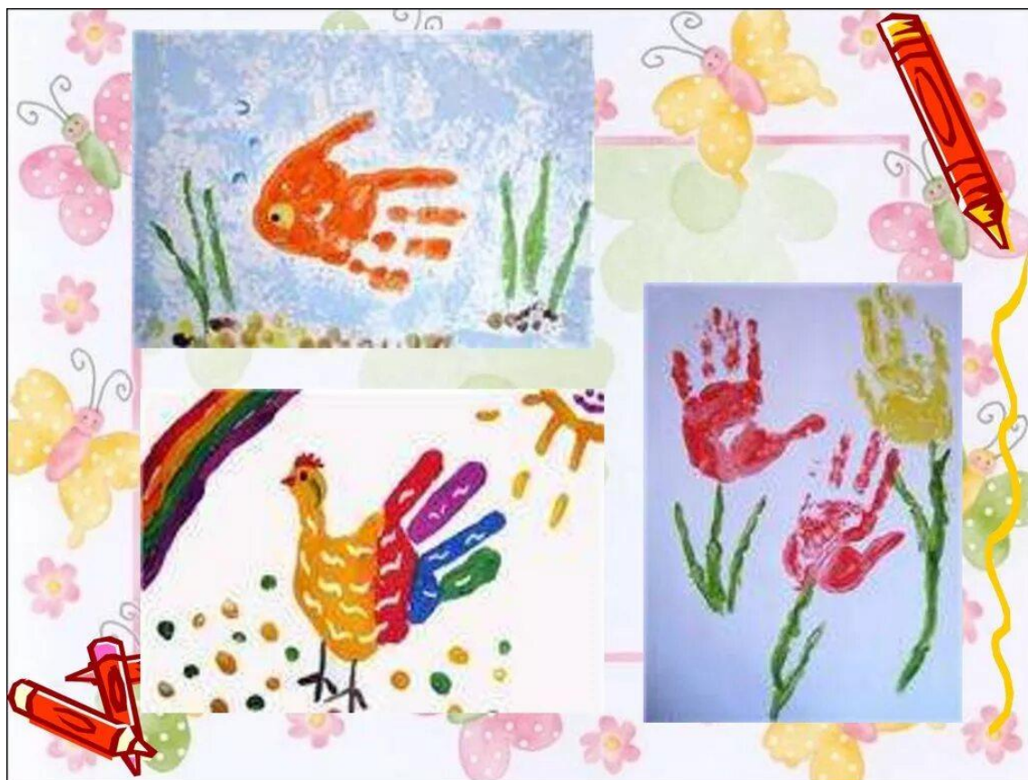
Пример техник рисования нетрадиционными способами

В нашем дошкольном учреждении воспитатели планируют систему занятий с учетом индивидуальных особенностей детей. Используют разные материалы, необходимые для работы с детьми. Детям до трёх лет ещё трудно справляться с кисточкой для рисования. Воспитатели ясельной группы учат детей рисовать их собственными ладошками и пальчиками. На занятиях создаётся творческий процесс педагога и детей при помощи разнообразного изобразительного материала, который проходит те же стадии, что и творческий процесс художника. Этим занятиям отводится роль источника фантазии, творчества, самостоятельности.