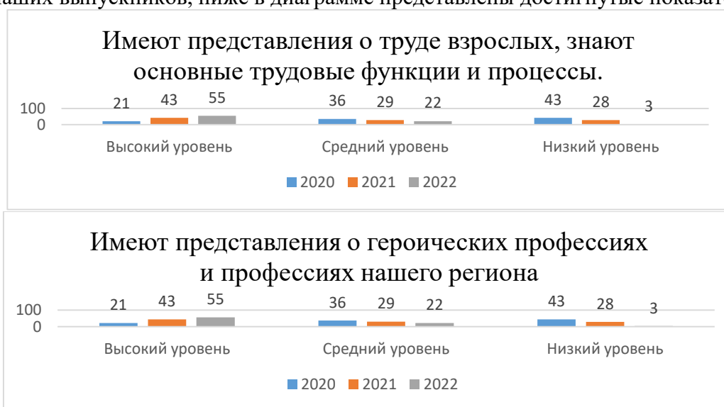
Таблица № 1

Важный аспект, рассматриваемый при создании РППС по реализации программы ранней профориентации дошкольников, это уровень сформированности у наших воспитанников знаний о профессиональной деятельности людей нашего региона. На протяжении трех лет нами проводилась работа по определению сформированности этих знаний у наших выпускников, ниже в диаграмме представлены достигнутые показатели.